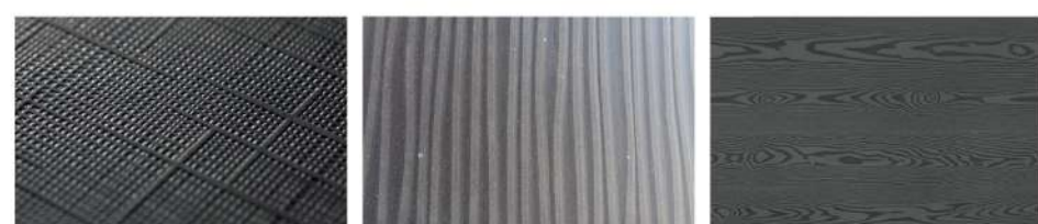
Fabric Ocean Classic Wood